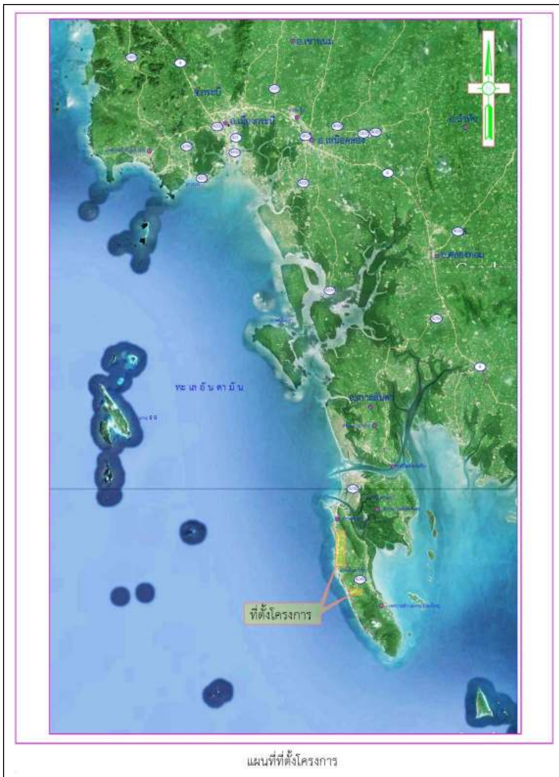
แผนที่ที่ติดตั้งโครงการ