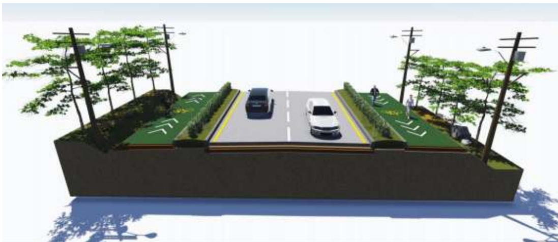
การปรับปรุงถนนรูปแบบที่2