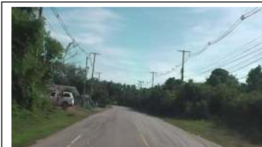
สภาพถนนสายบ้านศาลาด่าน-บ้านสังกาอู่ ที่เสนอปรับปรุงช่วงที่1