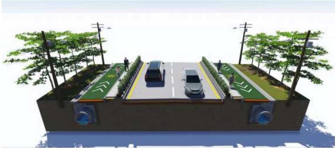
การปรับปรุงถนนรูปแบบที่1