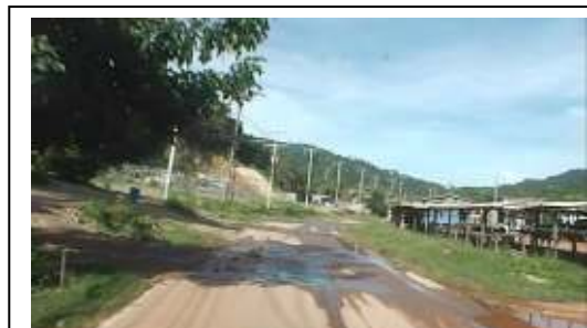
สภาพถนนสายบ้านศาลาด่าน-บ้านสังกาอู่ ที่เสนอปรับปรุงช่วงที่2