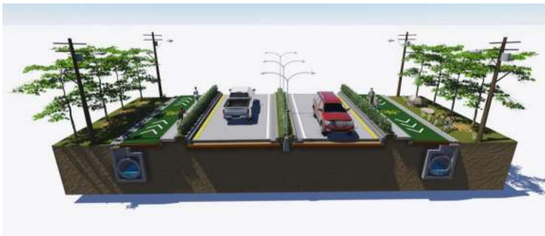
การปรับปรุงถนนรูปแบบที่3