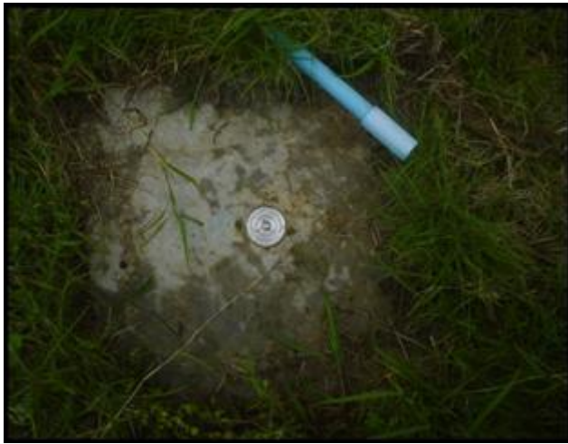
1. หมุดหลักฐานกระทรวงเกษตรและสหกรณ์