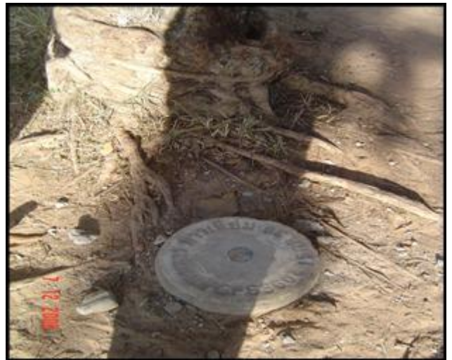
4. หมุดหลักฐานด้วยดาวเทียม GPS กรมแผนที่ทหาร