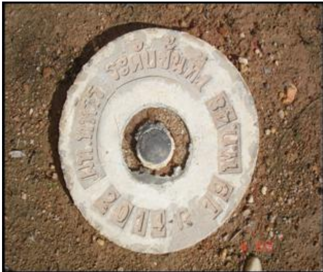
3. หมุดหลักฐานการระดับชั้นที่ 1 กรมแผนที่ทหาร