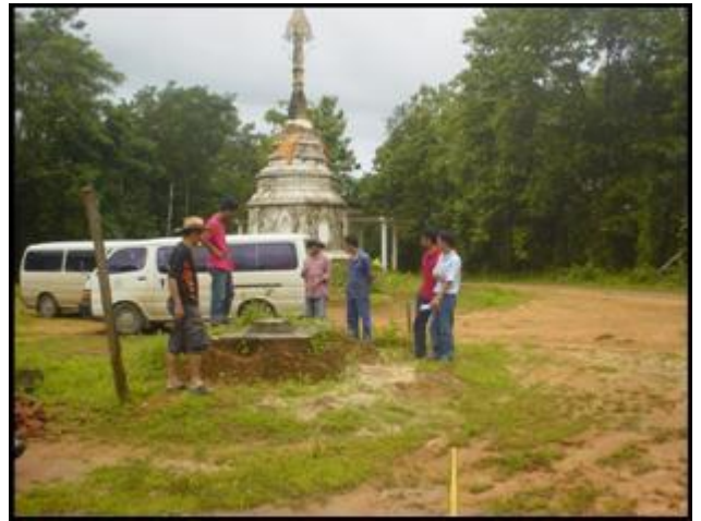
2. หมุดหลักฐานกรมแผนที่ทหาร