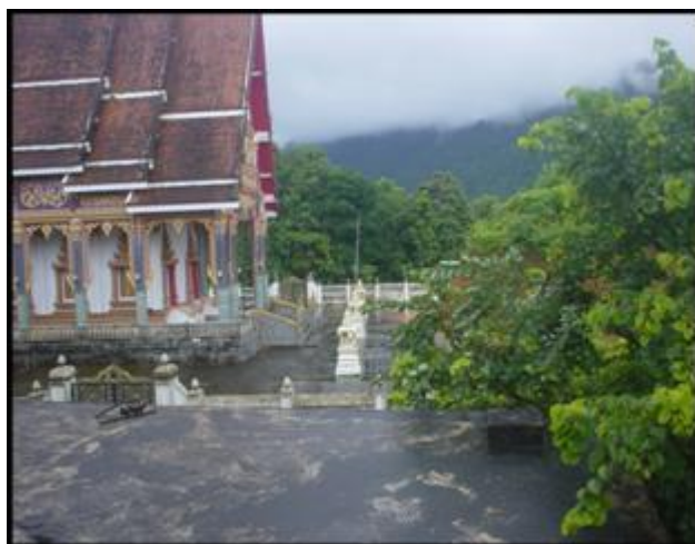
5. หมุดหลักฐานด้วยดาวเทียม GPS กรมที่ดิน